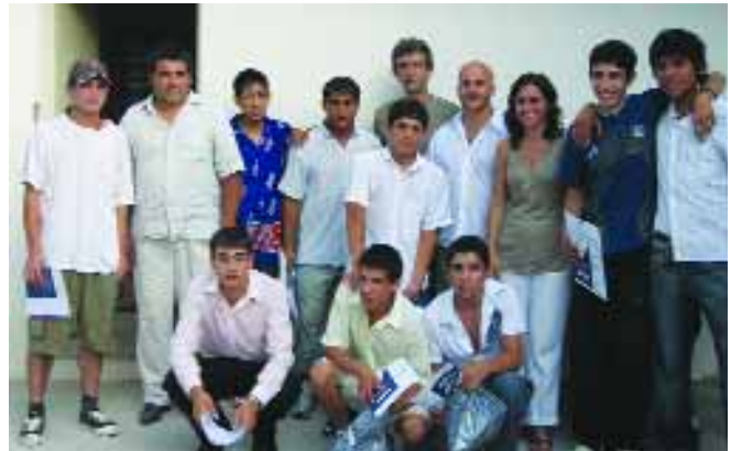
Alumnos del Curso de Hormigón Armado con personal de la fundación.