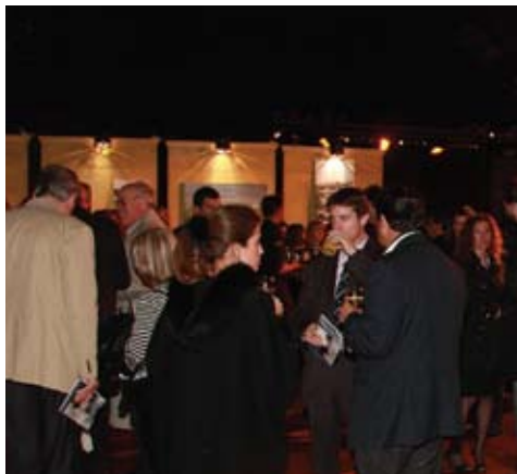
La tarde de lluvia no fue un obstáculo y más de 400 personas se reunieron para colaborar.