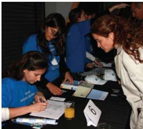
Para que más personas pudieran participar y colaborar, se presentaron varias opciones de productos.